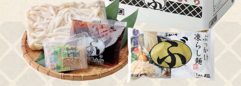
※写真は麺 たれ・トッピング1人前です。

温 温かいおうどんでお召し上がりいただけます。 冷 冷たいおうどんでお召し上がりいただけます。