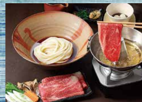
和牛しゃぶしゃぶ ぶっかけうどん