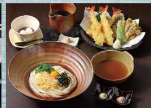
海老の天ぷら盛り合わせ ぶっかけうどん