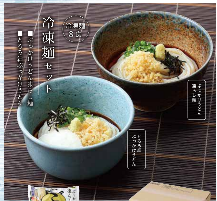
※写真の 1袋は1人前です。

【とろろ細ぶっかけうどん×4人前】 冷凍細麺300g(1人前)・ぶっかけうどんのたれ100g とろろ手・乾燥ねぎ・天かす・きざみのり・ごま・おろししょうが×各4