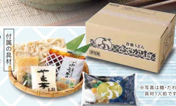
※写真は麺・たれ 具材1人前です。