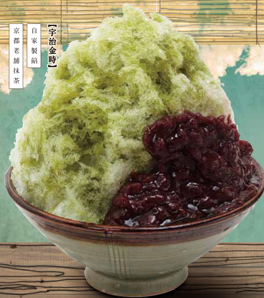
【宇治金時】 自家製餡 京都老舗抹茶

ふるいちには七十余年の歴史を持つ自家製の「餡」がある。伝統の味を守り続け、今では夏の風物詩となった「ふるいちのかき氷」。「ぶっかけ」のメに「かき氷」を注文される人も多く、店舗には十数種類のかき氷メニューがあります。おすすめは京都老舗の「抹茶」とふるいちの「歴史の餡」を使用した「宇治金時」です。素材にこだわり「一度食べたなら、また食べたくなる」自信作です。お立ち寄りの際はぜひお召し上がりください。