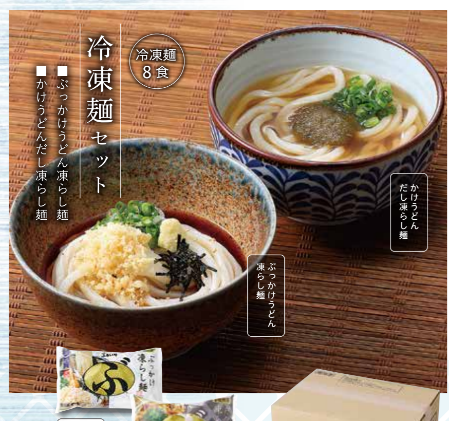
※写真の 1袋は1人前です。

【かけうどんだし凍らし麺×4人前】 冷凍麺300g(1人前)・かけうどんのだし300g 乾燥ねぎ・とろろこんぶ×各4