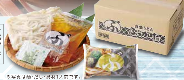
※写真は麺・だし・具材1人前です。 ※だしのパッケージが変更になる 場合がございます。