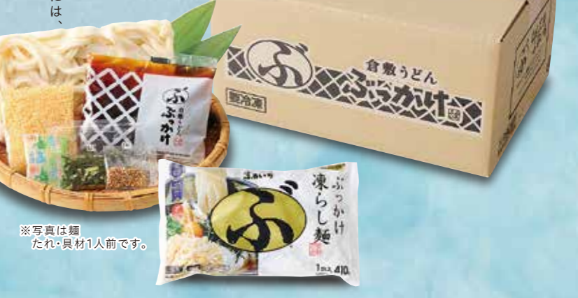
※写真は麺 たれ・具材1人前です。

冷凍麺300g(1人前)・ぶっかけうどんのたれ100g 乾燥ねぎ・天かす・きざみのり・ごま・おろししょうが×各12