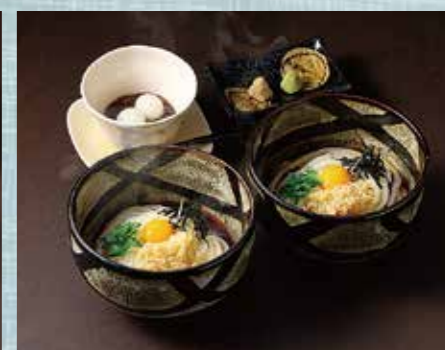
食べ比べセット<温ぶっかけ&冷ぶっかけ>